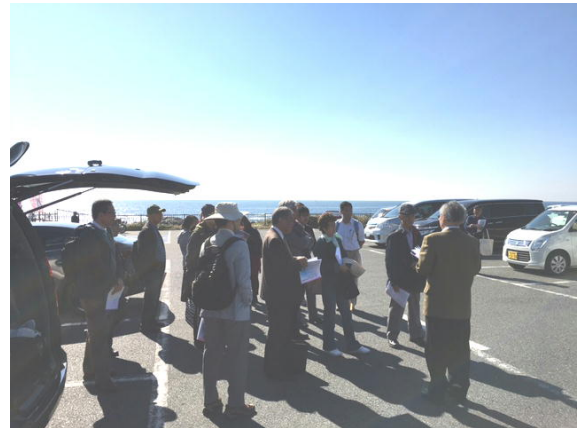
開演前に取水サイトを視察