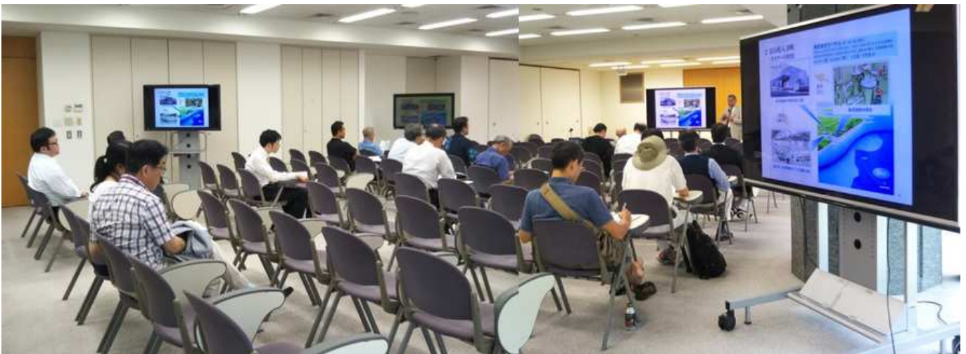
会場全景(沖縄久米島や長崎から一騎当千の24名の方にご参加いただきました)