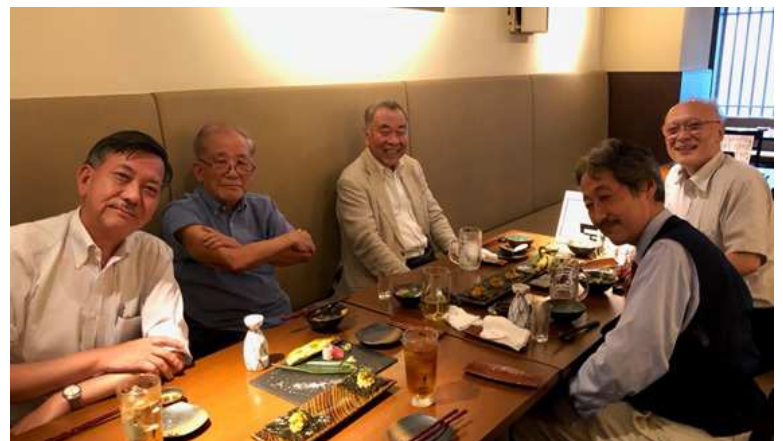
反省会 (蔵よし虎ノ門店)