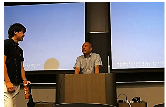
一般参加者の方と懇談する杉野会員（ネットワーキング）