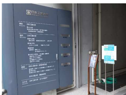
エントランス (案内)