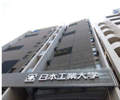
日本工業大学神田キャンパス

従来からの研究大会、シンポジウム、講演会/懇親会、マクロレビューに加え、新たにサタデーセミナーを通じ、一般の方へのマクロエンジニアリングの普及を図るとともにその社会実装による社会貢献に努めてまいりたいと考えております。今後ともご支援の程、よろしく願いいたします。