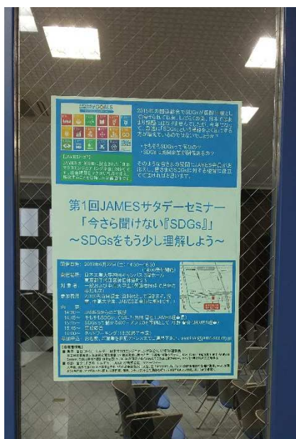
3F 多目的ホール(案内)